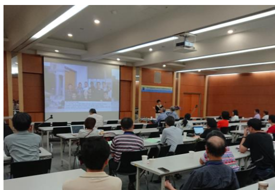
Symposium Session B (第 3 會議室)