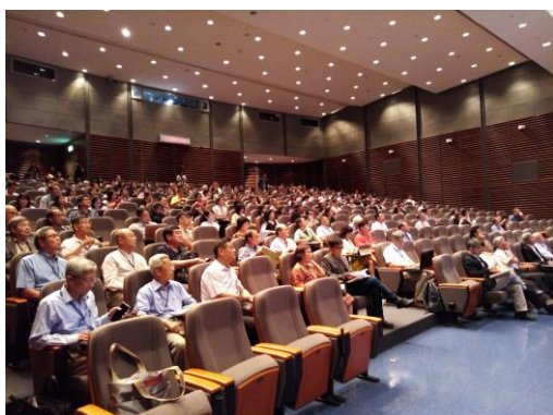
Symposium Session A (國際會議廳)

本次會議精心規劃 6 場專題演講，主題分別為：「Biomedical Science」、「Population Health Research」、「Cancer Research」、「Medical Engineering」、「Molecular Genetics and Medicine」及「Neural Science」，共邀請執行成果優良之整合性計畫主持人、本院研究人員或年輕研究學者及國內外專家等 24 位講員，於 2 個會場(國際會議廳及第 3 會議室)同步進行演講，分享最新的研究進展與寶貴的經驗，藉以讓與會者得到學術交流及研究合作的機會。