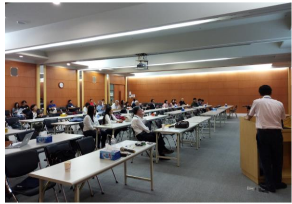
Poster Discussion (第 2 會議室)