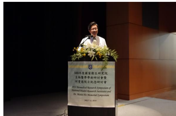
Plenary Lecture Speaker-張善政部長