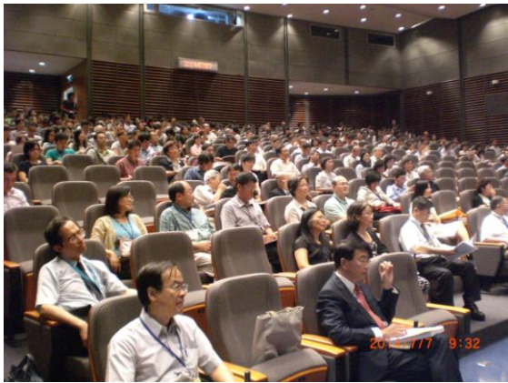
會場一：本院國際會議廳