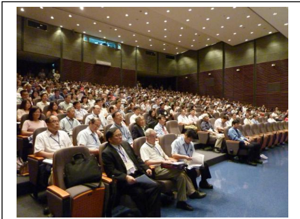
會場一：本院國際會議廳