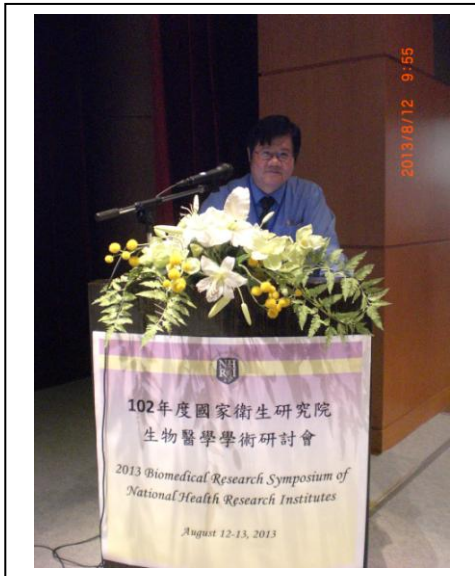
Plenary Lecture Speaker-洪明奇院士

102 年度國家衛生研究院生物醫學學術研討會（2013 Biomedical Research Symposium of NHRI）於 102 年 8 月 12 日至 13 日於本院會議中心順利辦理完成。此次會議參與人員除有整合性計畫研究人員外，並邀請參與院外計畫學術審查之國內、外專家約 60 位共同與會，另開放本院研究人員及國內各機構研究人員報名與會，總計人數達約 510 人次，可謂盛況空前，充分達到學術交流之目的。