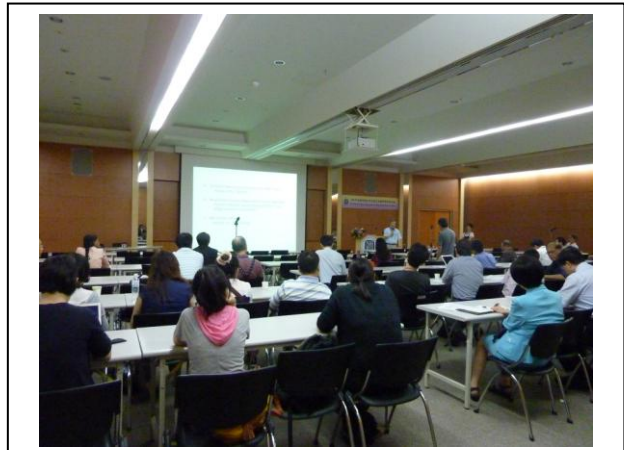
會場二：本院第三會議室