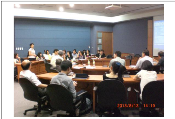
Poster Discussion -1