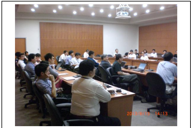
Poster Discussion -2