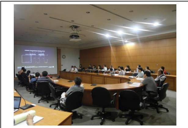
Poster Discussion -1