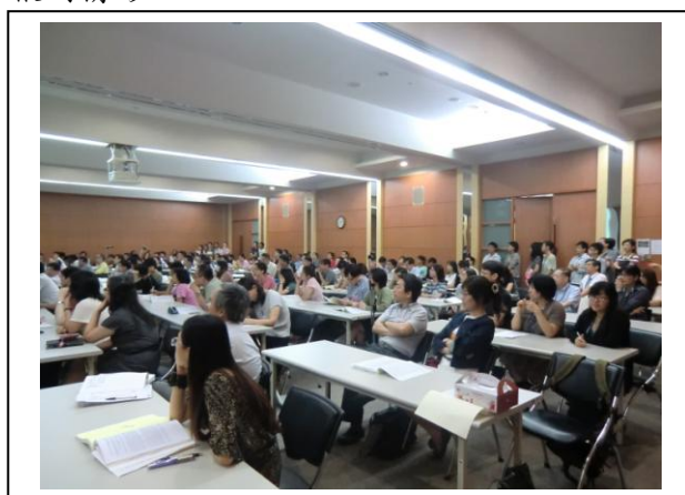
會場二：本院第三會議室