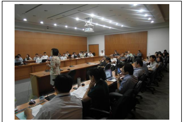
Poster Discussion -2