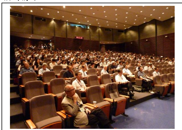
會場一：本院國際會議廳