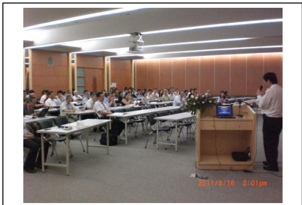
Poster Discussion -2