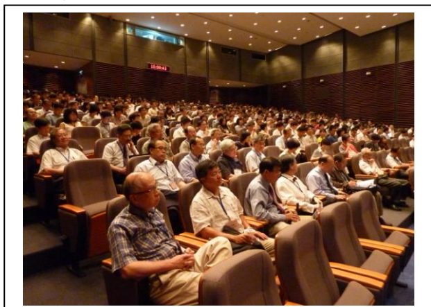
會場一：本院國際會議廳