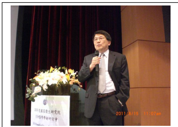
Plenary Lecture Speaker-劉昉院士

100年度國家衛生研究院生物醫學學術研討會（2011 Biomedical Research Symposium of NHRI）於100年8月15日至16日於本院會議中心順利辦理完成。此次會議參與人員除有整合性計畫研究人員外，並邀請參與院外計畫學術審查之國內、外專家約60位共同與會，另開放本院研究人員及國內各機構研究人員報名與會，總計人數達約550人次，可謂盛況空前，充分達到學術交流之目的。