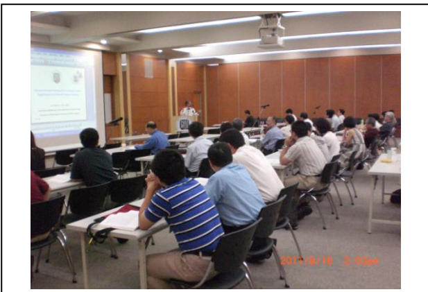
Poster Discussion -1