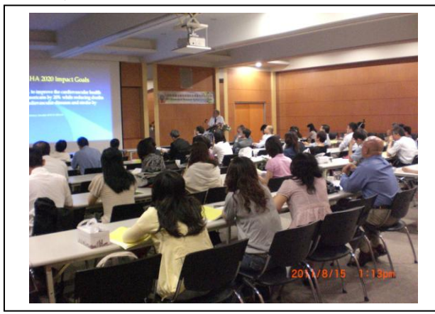
會場二：本院第三會議室