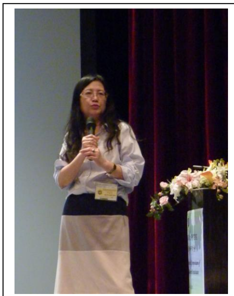
Plenary Lecture Speaker-吳妍華院士